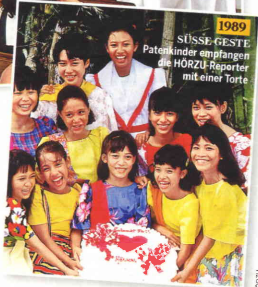
1989 SÜSSE GESTE Patenkinder empfangen die HÖRZU-Reporter mit einer Torte

die Kinder auch genau das erhalten, was sie besonders dringend brauchen.“ In den letzten 30 Jahren hat der Verein dafür insgesamt über acht Millionen Euro aufgebracht. „Eine großartige Summe, die viel bewirkt hat“, so der Reporter. „Aber die Situation ist noch immer dramatisch. Und weitere Hilfe ist dringend nötig.“