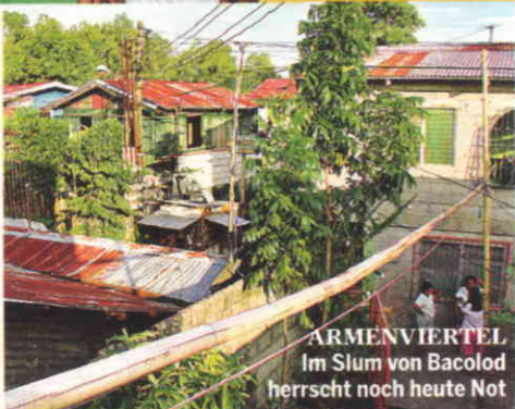
ARMENVIERTEL Im Slum von Bacolod herrscht noch heute Not